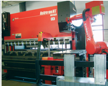
BILD 5. IMMER BEREIT: Der Be- und Entladroboter ›Astro-MP 20‹ kurz vor der Übergabe einer Platine an den Astro-100 NT