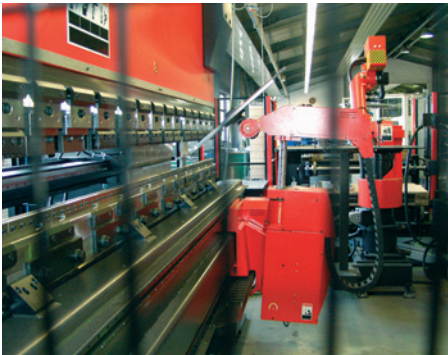
BILD 4. HINTER GITTERN: Bediener dürfen und müssen auch nicht eingreifen, wenn der Roboter ›Astro-100 NT‹ am unteren Pressbalken der Abkantpresse verfährt und das Blech beim Biegen führt