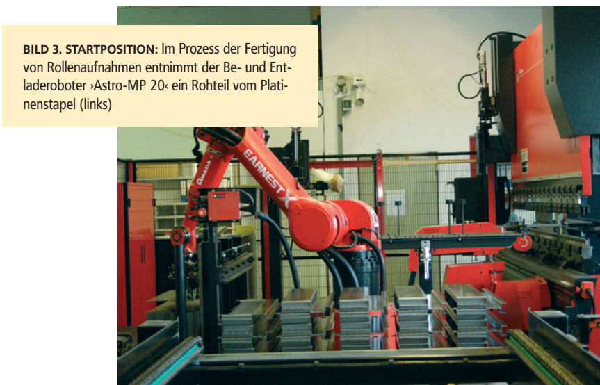
BILD 3. STARTPOSITION: Im Prozess der Fertigung von Rollenaufnahmen entnimmt der Be- und Entladeroboter »Astro-MP 20« ein Rohteil vom Plattenstapel (links)

Von der jetzigen Konzeption des Astro, der direkt auf einer Linearachse am unteren Pressbalken der Abkantpresse montiert ist, verspricht sich Amada eine weitaus größere Resonanz. Michael Groß, Produktvertriebsleiter Abkant- und Scherntechnik bei Amada (Bild 1): »Das Hervorhebenswerte der Lösung ist ihre Homogenität. Der Astro-100 – das Pendant zum Astro-50, der für größere Werkstücke ausgelegt ist – wurde mit seiner einzigartigen Greifertechnik speziell für das Abkanten entwickelt. Gemeinsam mit der Umformmaschine, dem Be- und Entladeroboter und der Software »Astro-CAM« bildet er eine stimmige Einheit, in der jede Komponente ihre Vorzüge zur Geltung bringt. So verlängert sich die Hauptzeit des Biegeroboters, weil er keine Handhabungstätigkeiten übernehmen muss – das macht der andere Roboter. Die 17 Achsen werden aus einer Software heraus mit Programmen versorgt, so dass die Lauffähigkeit sehr schnell ge-