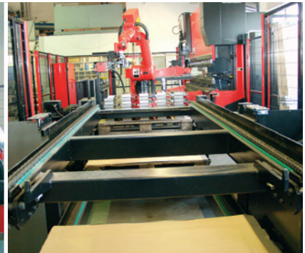
BILD 6. FIX UND FERTIG: Die volle Palette mit den Werkstücken gelangt über einen Palettenwechsler zur Entnahmeposition

ben ist. Ein weiterer Vorteil: Weil Amada für die gesamte Zelle verantwortlich zeichnet, hat der Anwender nur eine ›Schnittstelle‹, wenn es um Lieferung und Service geht.« Nach Groß' Auffassung handelt es sich bei dieser Industrieroboterlösung »um das führende System am Markt«. Dabei stehe der Roboter nicht im Wettbewerb mit einem Biegezentrum, denn Biegezentren fertigen in der Regel großflächige dünne Werkstücke mit nicht so anspruchsvoller Kantengeometrie.